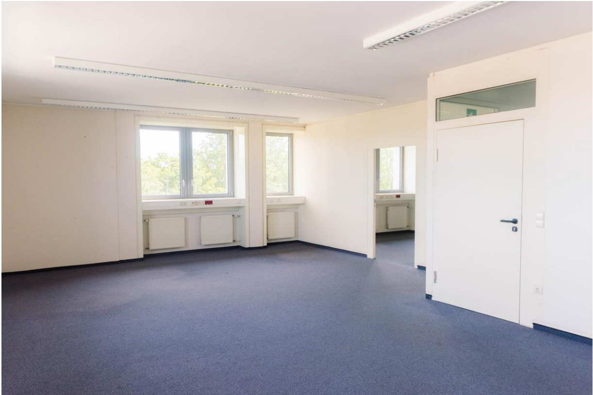
Bürobeispiel 3 Turm