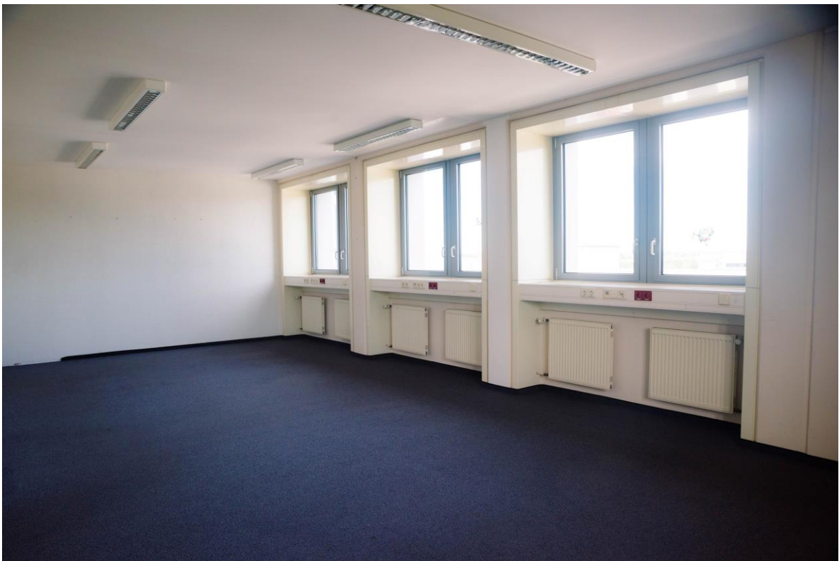
Bürobeispiel 5 Turm