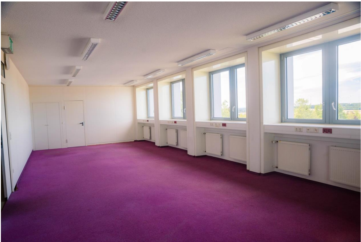
Großraum Bürobeispiel 1 Turm