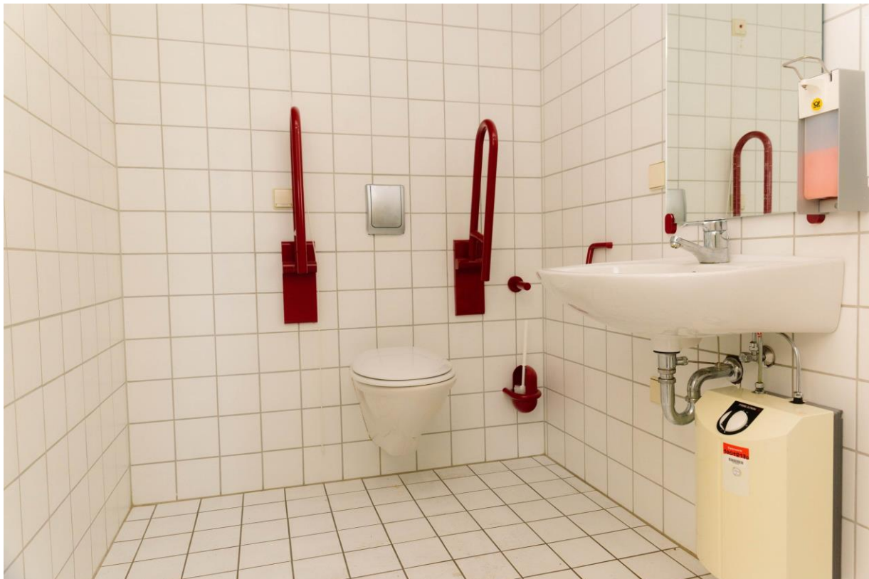
Behinderten WC Turm