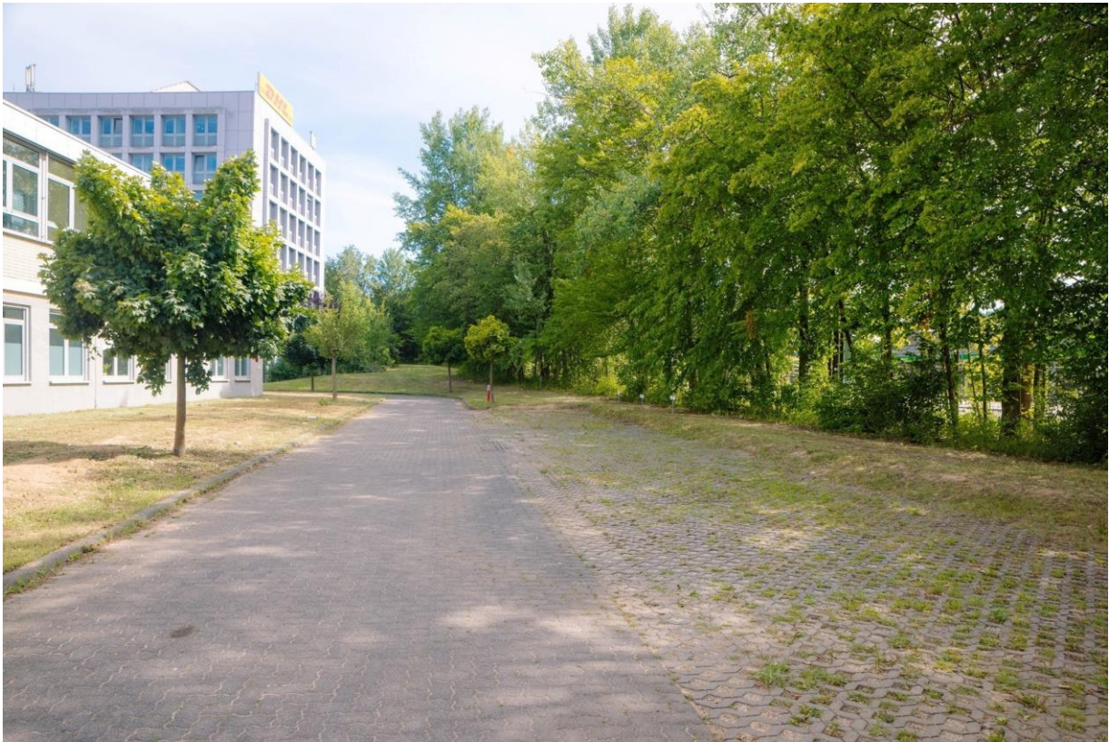
Freiflächen DHL Turm