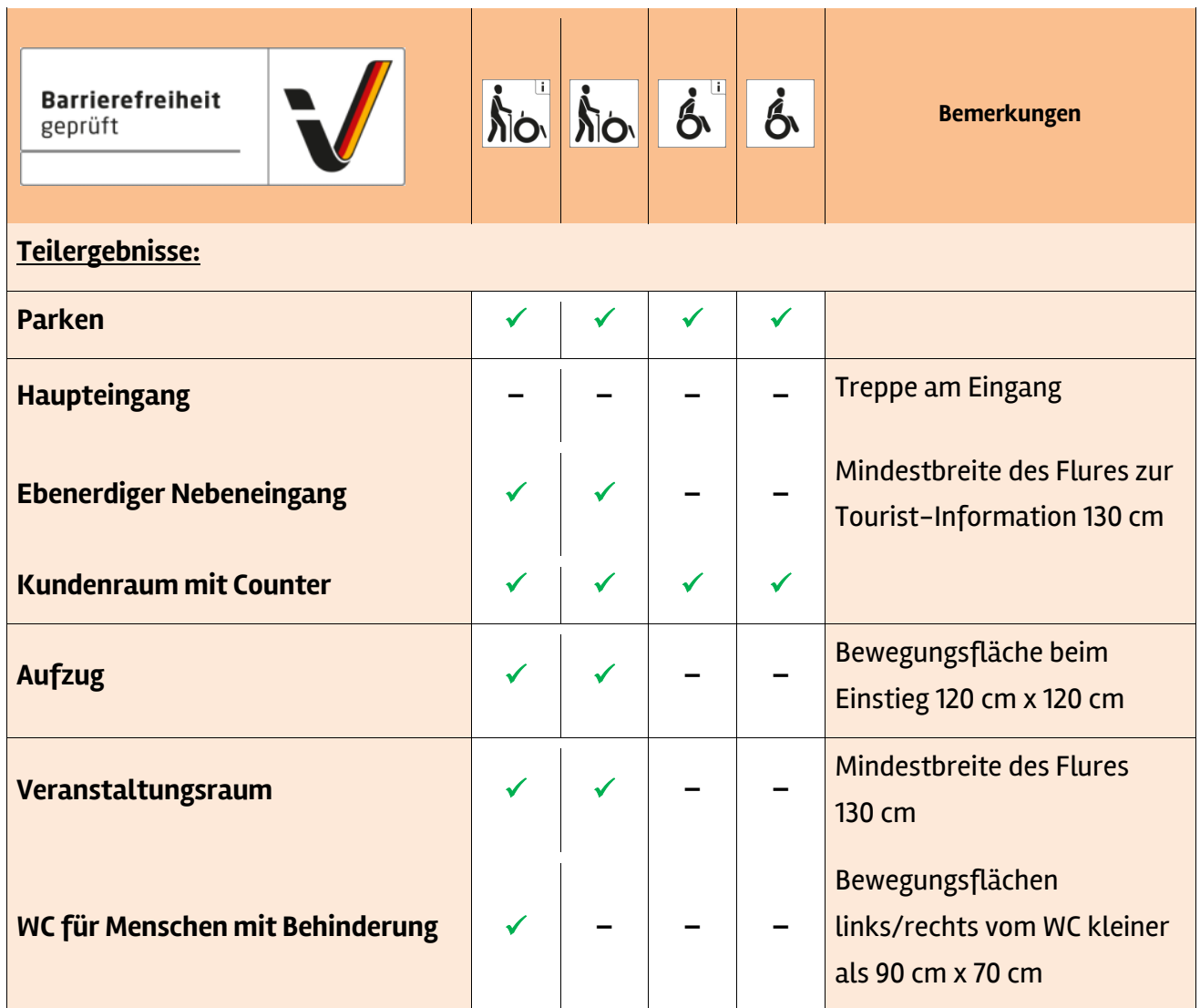
Tabelle 1: Überblick über das Prüfergebnis